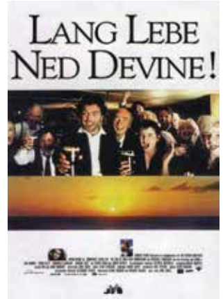
Lang lebe Ned Devine! (IE, 1998)