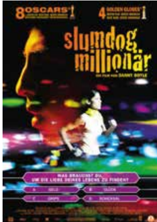
Slumdog Millionaire (GB, 2008)

Das übergeordnete Thema der drei Kinoabende steht dieses Jahr unter dem Motto "Das liebe Geld". Wir nehmen damit augenzwinkernd Bezug auf die andauernde Finanzdebatte in der Gemeinde Köniz. Aber keine Sorge, es geht nicht um Steuern in unseren Filmen. Filmstart ist jeweils ab ca. 20.30 Uhr.