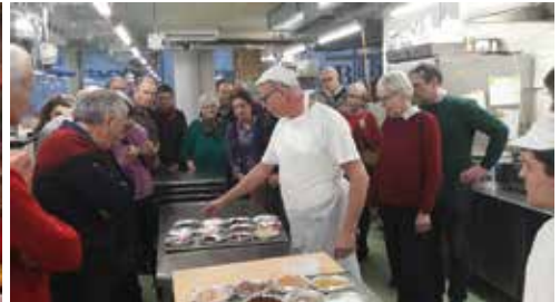
Fotos Neujahrsapéro 2019 Confiserie Beeler AG, Liebefeld